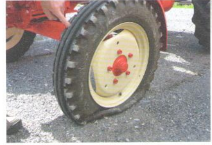
Nagel gesucht... und gefunden.