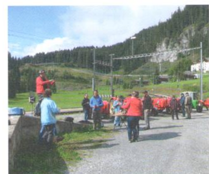
Bündner Znüni am Bahnhof in Litzirüti.