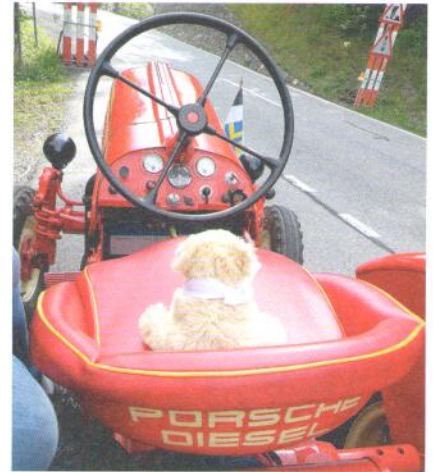
Ein haariger Porsche-Diesel Freund.

In Arosa angekommen hiess es runterschalten, hoch bis zur Mittelstation der Weisshornbahn und Besuch im Luxus Bärenland. Nun ohne Traktoren mit der Bahn auf den 2650 Meter hohen Weisshorngipfel. Leider war die Sicht durch den aufziehen-