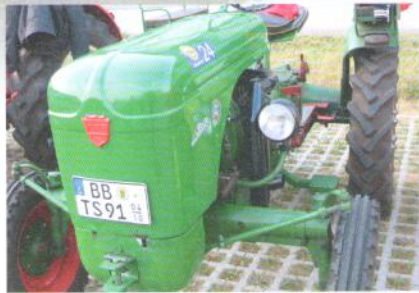
Ein grüner «Allgaier» ist immer dabei.