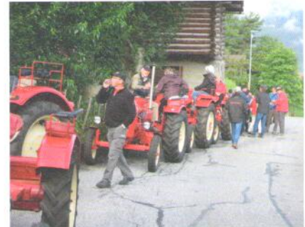
Zwischenstopp mit frischem Holundersirup.

Bericht Ernst Utiger