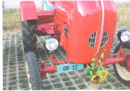
Der Organisator aus Graubünden.