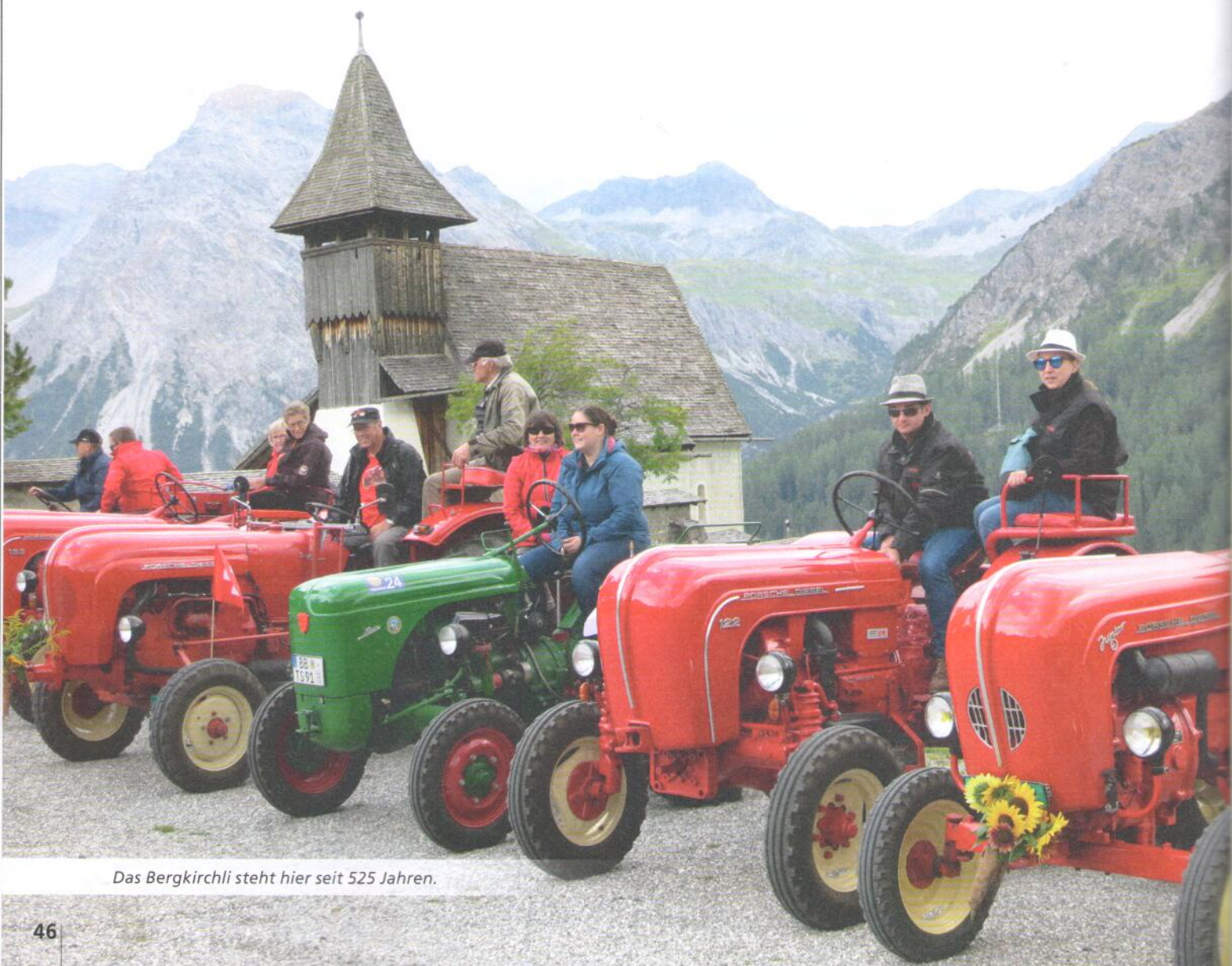
Das Bergkirchli steht hier seit 525 Jahren.